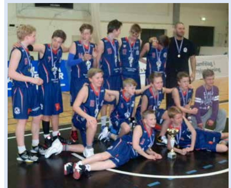
Lið Keflavíkur í 8. flokki stóð uppi sem Íslandsmeistari á dögnum. Strákarnir unni Fjölni í hreinum úrslitaleik.