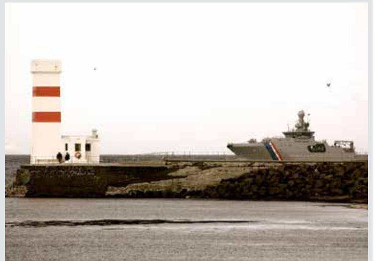
Þessa skemmtilegu mynd tók Guðmundur Magnússon fyrir stuttu.