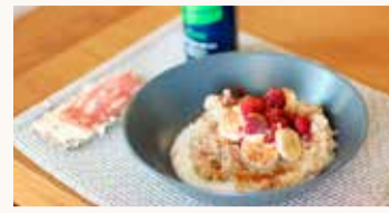
Morgunmatur Hjá Björk er morgunmaturinn af hollari gerðinni.

Svo finnst mér hrökkkex með smjöri og spægipylsu gott. Og Nocco með.