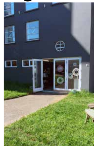
Búðin Verslunin Búðin er staðsett í Listagilinu á Akureyri, á móti Sjoppunni.

„Akureyringar eru orðnir nógu hressir fyrir svona“