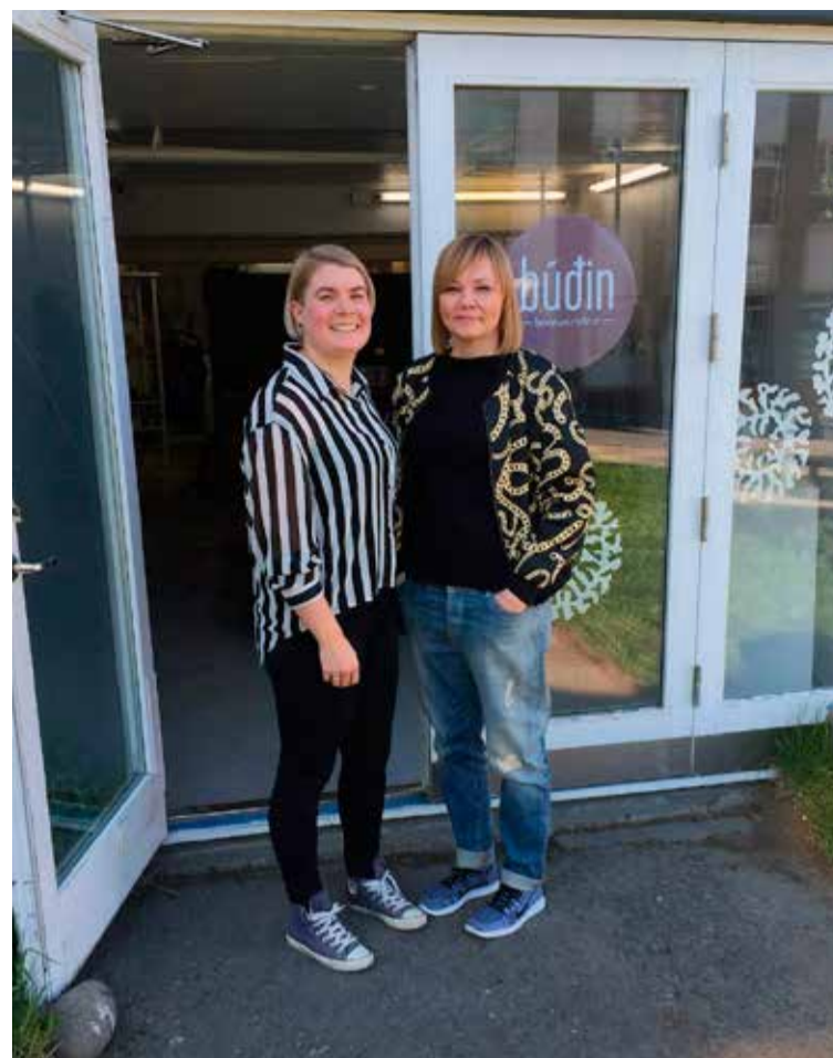
Vinkonur Eidís Anna hannar undir nafninu Múndering en Eva er með eyrnalokkana Merkja.

Akureyri vikublað kemur út vikulega og er dreift frítt frá Hvammstanga að Bakkafirði í tæplega 15 þúsundum eintökum.