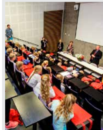
Vísindaskólinn Nú þegar hafa 70 krakkar skráð sig í Vísindaskóla unga fólksins sem haldinn verður í annað sinn í sumar.