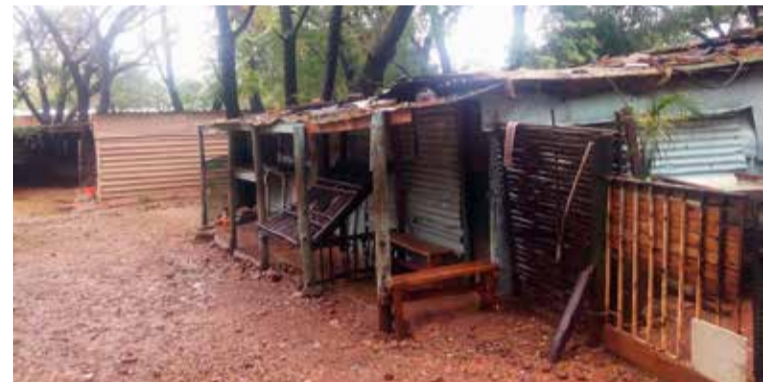
Fátækt Í þessum skúrum búa heilu fjölskyldurnar.