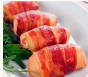
Kvöldmatur Kjúklingur, beikon og döðlur.

Kjúklingalæri þar sem maður rúllar kjúklingnum utan um eina döðlu og vefur einni til tveimur beikonskífum yfir kjúklinginn. Ofninn á 200 °C í ca 25–30 mín.