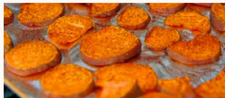
Sætar kartöflur Björk segist borða allan mat en hamburgarar, steik og mjólkurgrautur séu í uppahaldi.