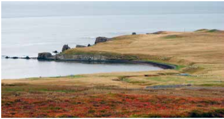
Bakki Lögreglan gerði fáar athugasemdir er varða aðbúnað og önnur réttindamál innflutts vinnuaflds.

Samkvæmt færslu lögreglunnar hefur nokkuð verið um á landsvísi að fyrirtæki hafi ekki verið með allt sitt á hreinu hvað varðar aðbúnað, launakjör og ýmis