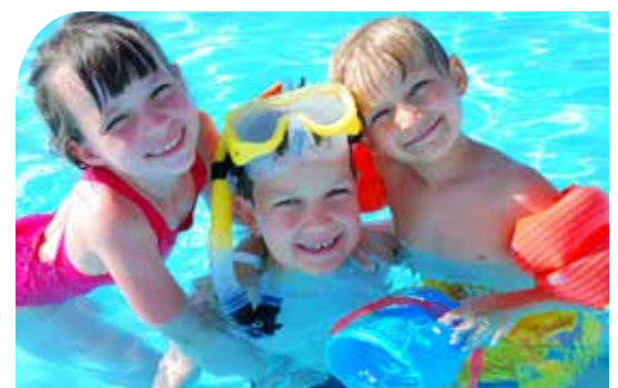
Ný sundlaug og íþróttastaða verður byggð í hverfinu.

Sendu okkur fyrirspurn á netfangið lodir@reykjavik.is eða hringdu í síma 411 11 11. Starfsmenn á skrifstofu eigna og atvinnuþróunar leiðbeina þér með ánægju.