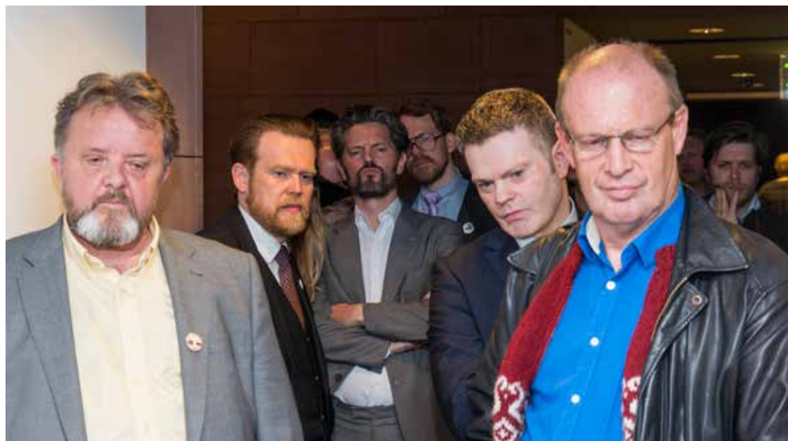
Oddvitar sex framboða fylgjast spenntir með tölum á sjónvarpsskjá í Ráðhúsinu á kosninganótt. Kjörsókn var hin minnsta í manna minnum.

Betra veður og betri tímasetning gæti þá verið til aukningar á kjörsókn. Hins vegar er lýðræði ekki sjálfsgæddur hlutur. Áhrifin höfum við á fjögurra ára fresti til að breyta og bæta og okkur ber samfélagsleg skylda til að nýta þennan rétt. Ég held að þurfi að gera öllum aldurshópum grein fyrir því, sérstaklega nýjum og ungum kjósendum. Okkar atkvæði skiptir máli, sama hvort það er autt, ógilt eða merkt bókstaf. Mæting á kjörstað er fyrir öllu. Án mætingar tel ég okkur ekki hafa rétt til að kvarta og kveina yfir stjórnvöldum.“