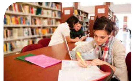
Menningarstarf verður mikilvægur hluti af starfsemi hinna nýju þjónustumannvirkja.