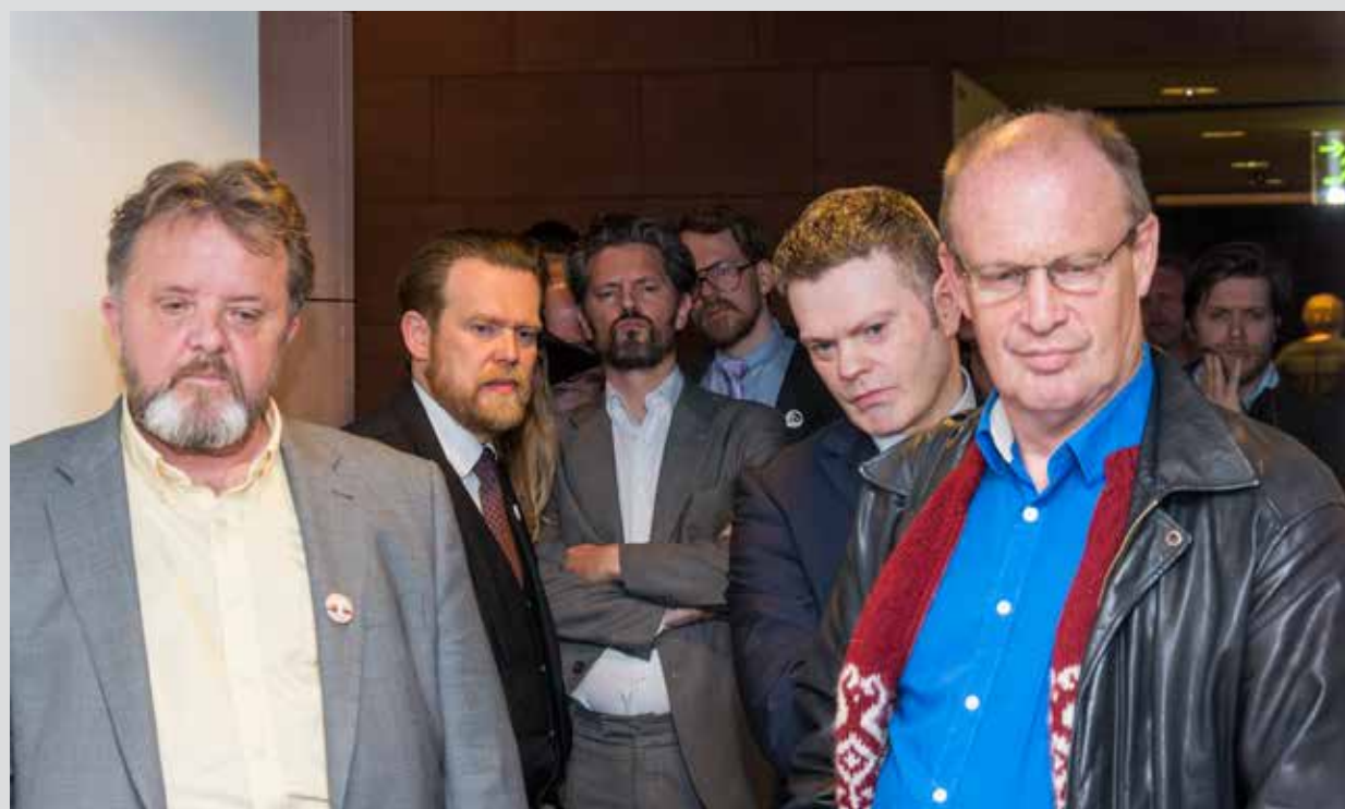
Oddvitar sex framboða fylgjast spennir með tölunum á kosningarótt. Átta karlar voru kjörnir í borgarstjórn og sjö konur. Hlutfallið sneri öfugt hjá fráfarandi borgarstjórn. Kjörsókn mældist 63 prósent, sem þykir mjög lítið. Sjá umfjöllun og umræðu bls. 2, 4 og 8.